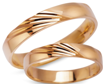
model 934, szerokość 3,5mm