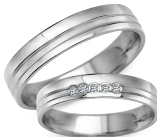
model 932W, szerokość 4mm model 932WK** **, szerokość 4mm

Złoto próby 0,585. *Dostępne również w próbie 0,333. **Model z cyrkoniami, istnieje możliwość osadzenia diamentów. Aktualne ceny: YES.pl