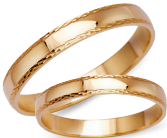
model 450*, szerokość 3mm lub 4mm