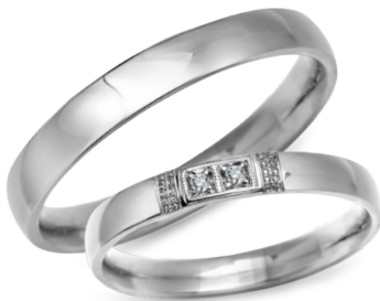
model 702*, szerokość 3mm model 453WK**, szerokość 3mm