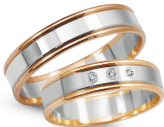
model 928, szerokość 5mm model 928K*, szerokość 5mm