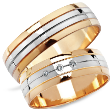
model 919, szerokość 5mm model 919K*, szerokość 5mm