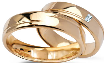
Paso Doble szerokość 6mm, obrączka damska diament (szlif bagietowy) 0,03ct