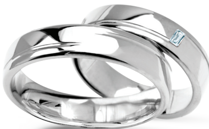
Paso Doble II szerokość 6mm, obrączka damska diament (szlif bagietowy) 0,03ct