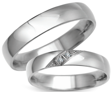
model 702*, szerokość 4mm model 454WK**, szerokość 4mm