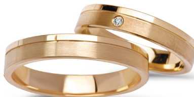
model 269K*, szerokość 4mm, diament 0.02ct model 269*, szerokość 4mm