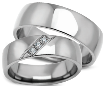
model 627, szerokość 7mm model 627K*, szerokość 6mm