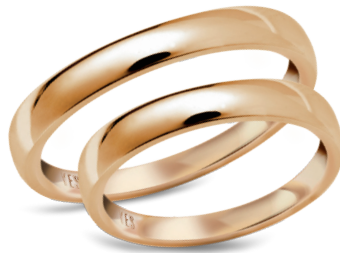
model 733*, szerokość 3mm