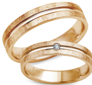
model 550*, szerokość 4mm model 550K** **, szerokość 4mm