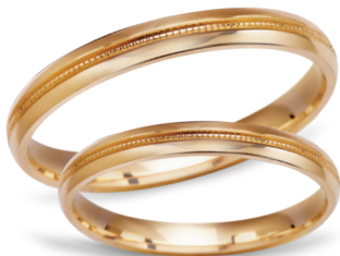
model 451*, szerokość 2,5mm lub 3,5mm