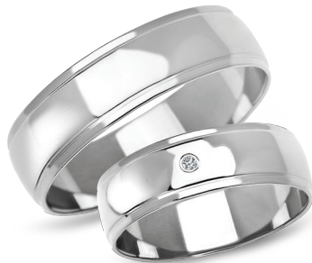
model 901W, szerokość 6mm model 901WK*, szerokość 6mm