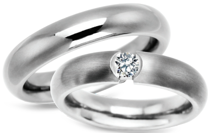
model 625, szerokość 5mm model 625K*, szerokość 5mm