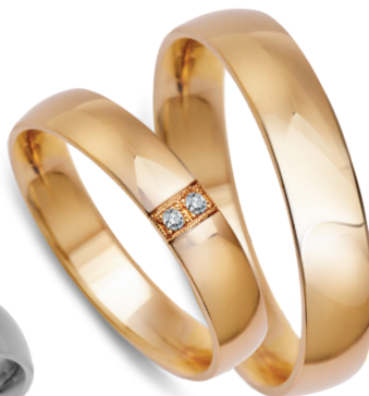
model 452K* **, szerokość 4mm model 702*, szerokość 4mm