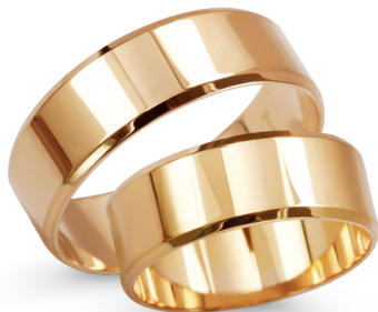
model 927, szerokość 7mm