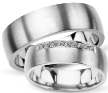
model 630, szerokość 7mm model 630K*, szerokość 6mm