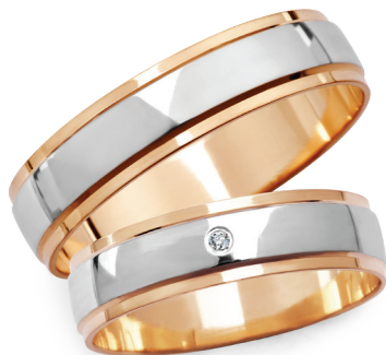
model 911, szerokość 5mm model 911K*, szerokość 5mm