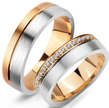
Twist* szerokość 5,5mm, obrączka damska 40 diamentów o łącznej masie 0,28ct