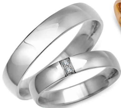
model 702*, szerokość 4mm model 452WK**, szerokość 4mm