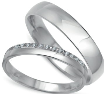
model 551W* , szerokość 3,5mm model 551WK* ** , szerokość 2,5mm

Złoto próby 0,585. *Dostępne również w próbie 0,333. **Model z cyrkoniami, istnieje możliwość osadzenia diamentów. Aktualne ceny: YES.pl