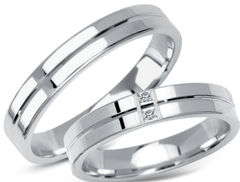
model 267W, szerokość 4mm model 267WK, szerokość 4mm 2 diamenty o łącznej masie 0,02ct