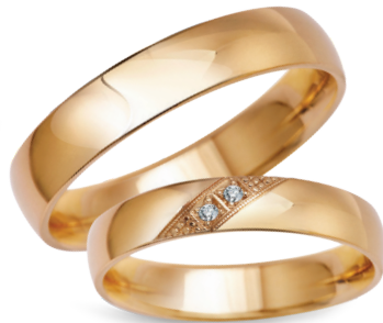
model 702*, szerokość 4mm model 454K*. **, szerokość 4mm