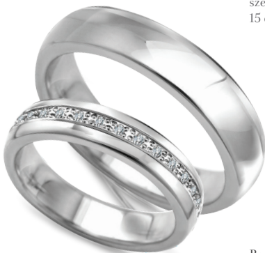
Boogie szerokość 4,5mm, obrączka damska 15 diamentów o łącznej masie 0,15ct

Złoto próby 0,585. Aktualne ceny: YES.pl