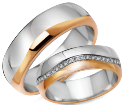
Foxtrot* szerokość 6mm, obrączka damska 48 diamentów o łącznej masie 0,24ct