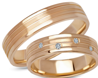
model 268*, szerokość 5mm model 268K*, szerokość 5mm 4 diamenty o łącznej masie 0,08ct