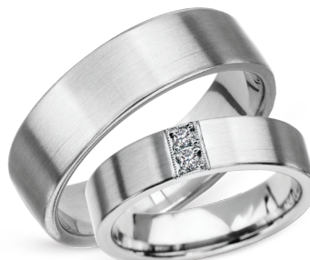
☞ model 601, szerokość 6mm model 619K*, szerokość 5mm

Tytan.*Model z cyrkoniami. Jakość każdego diamentu jest poświadczona Certyfikatem YES.