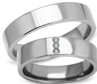
model 628, szerokość 5mm model 628K*, szerokość 5mm