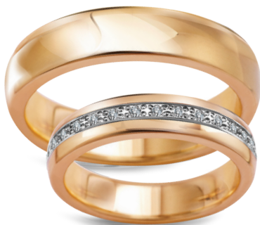
Boogie szerokość 4,5mm, obrączka damska 15 diamentów o łącznej masie 0,15ct