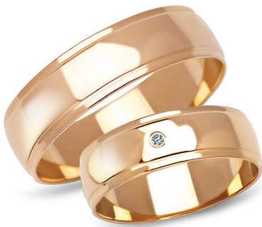
model 901, szerokość 6mm model 901K*, szerokość 6mm