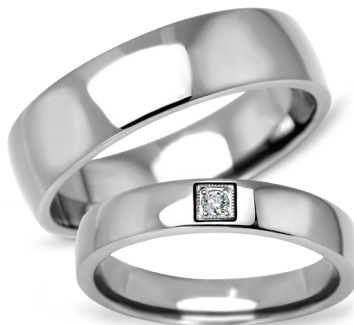
model 629, szerokość 6mm model 629K*, szerokość 4mm

Tytan. *Model z cyrkoniami. **Tytan, złoto próby 0,750. Modele obrączek tytanowych dostępne są do rozmiaru 69 włącznie. Aktualne ceny: YES.pl