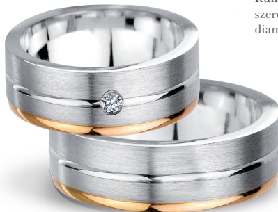
Rumba szerokość 6mm, obrączka damska diament 0,05ct

Złoto próby 0,585. *W przypadku obrączek damskich liczba kamieni i ich masa zależy od rozmiaru obrączki. Aktualne ceny: YES.pl