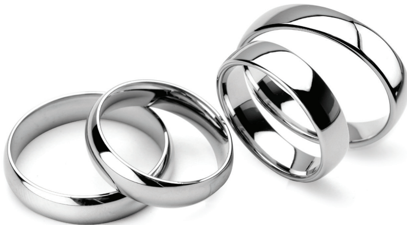
⌘ Tango, szerokość 3-6mm