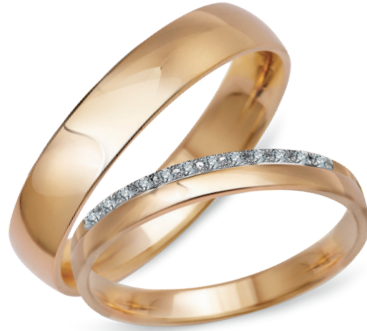
model 551*, szerokość 3,5mm model 551K* ** , szerokość 2,5mm