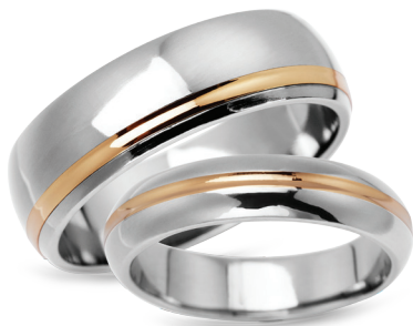
model 622**, szerokość 7mm model 623**, szerokość 5mm