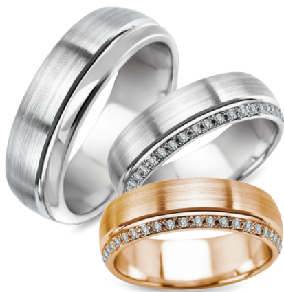
Boston szerokość 6mm, obrączka damska 20 diamentów o łącznej masie 0,1ct

Złoto próby 0,585. *W przypadku obrączek damskich liczba kamieni i ich masa zależy od rozmiaru obrączki. Aktualne ceny: YES.pl