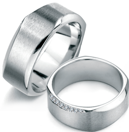
Samba szerokość 7,5mm, obrączka damska 7 diamentów o łącznej masie 0,07ct