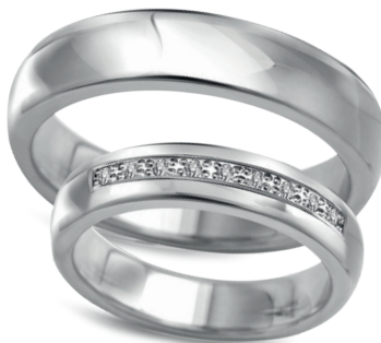
model 830W, szerokość 4,5mm model 830WK/1*, szerokość 4,5mm