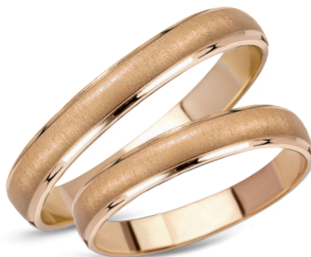
model 511, szerokość 3mm