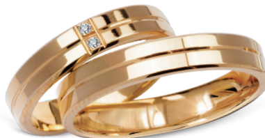
model 267K*, szerokość 4mm 2 diamenty o łącznej masie 0,02ct model 267*, szerokość 4mm