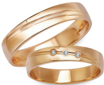
model 933, szerokość 4mm model 933K**, szerokość 4mm