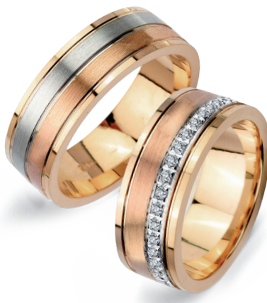
Salsa* szerokość 7mm, obrączka damska 40 diamentów o łącznej masie 0,28ct

Złoto próby 0,585. *W przypadku obrączek damskich liczba kamieni i ich masa zależy od rozmiaru obrączki. Aktualne ceny: YES.pl