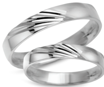
model 934W, szerokość 3,5mm