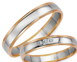
model 930, szerokość 3,5mm model 930K*, szerokość 3,5mm