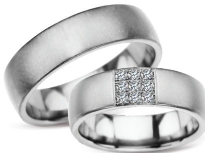
model 624, szerokość 6mm model 624K*, szerokość 6mm