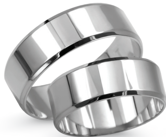
model 927W, szerokość 7mm